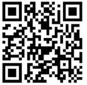
Scanner et inscrivez-vous

PAIEMENT A L'INSCRIPTION AVANT LE 08 JUIN 2026